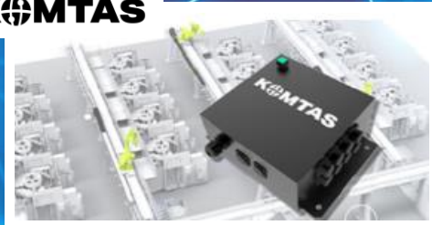
工具モニタリングシステム