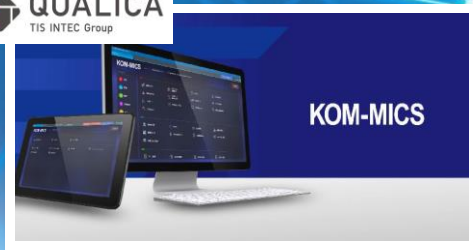
工場の生産性改善システム